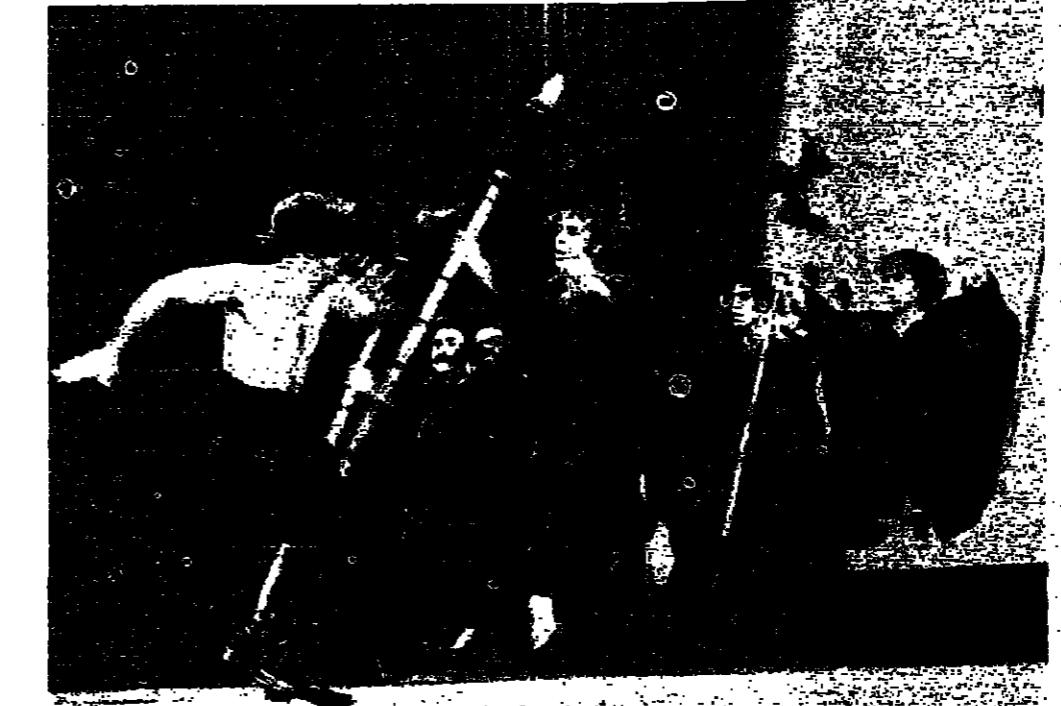
فرقة كركلا تستعرض رقصها العربي التقليدي

هي بعد ذاتها ، ذات مشهور جمالي ، وفخرهم ، فخراهم غيرة العريس في المشهد الأول وتتميز المشاهد الباقية بجمع بين الأصوات والآداء والصور في إطار يوحي ، بنوع من استجداء المشاعر السطحية للجمهور اللبناني الزارع . هذه التراتيل والتراكيب ، وأوتت هذا العرض في شكله جات نسي مطبوعاً مع جملته ، لأنها نسبت الرقص وتحتفظ برواياته وصحته وهو موهبة جديدة ، ولأنها جاءت بدون مسرورات حقيقة وأساسته . هذا العرض في شكله جات نسي مطبوعاً مع جملته ، لأنها نسبت الرقص وتحتفظ برواياته وصحته وهو موهبة جديدة ، ولأنها جاءت بدون مسرورات حقيقة وأساسته . هذا العرض في شكله جات نسي مطبوعاً مع جملته ، لأنها نسبت الرقص وتحتفظ برواياته وصحته وهو موهبة جديدة ، ولأنها جاءت بدون مسرورات حقيقة وأساسته .